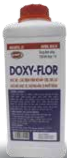
Chai 10ml, 100ml, 1 lit

- Liều chữa: 1ml/2 kg TT. Ngày uống 2 lần. Dùng liên tục từ 3-5 ngày.