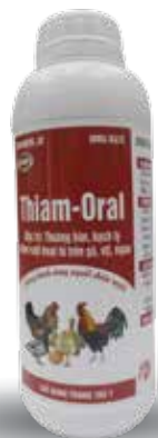
Chai 1 lít