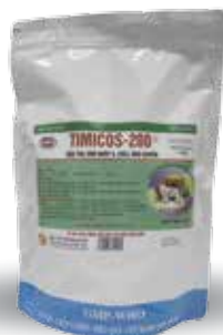
Túi 100g, 1kg

Ngừng dùng thuốc trước khi giết mổ từ 5-7 ngày.