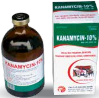
Chai 10ml, 100ml