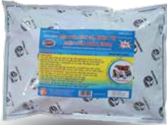
Túi 10g, 50g, 100g, 1kg