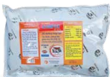
Túi 100g, 1kg