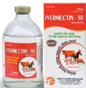
Chai 10ml, 100ml