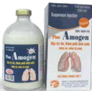
Chai 20ml, 100ml