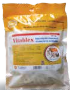
Túi 100g, 1kg