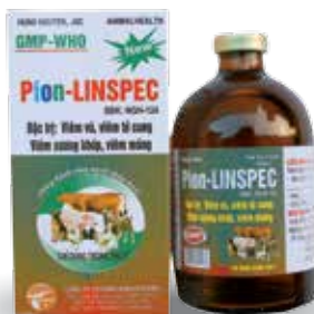
Chai 20ml, 100ml

- Gà, Vịt: 1ml / 5-8 kg TT / ngày Dùng từ 3-5 ngày.