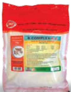
Túi 100g, 500g, 1kg