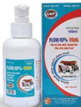
Chai 100ml, 1 lít