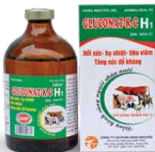
Chai 20ml, 100ml