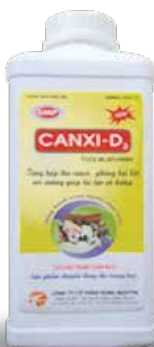
Chai 100ml, 1000ml