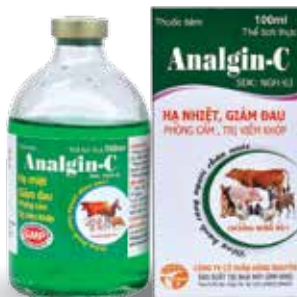
Chai 20ml, 100ml