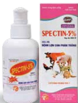
Chai 10ml, 100ml, 500ml, 1 lit