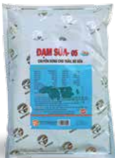
Túi 500g, 1kg