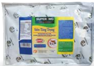
Túi 500g, 1kg, 10kg

Trộn với thức ăn Heo thịt, Gà, Vịt, Ngan thịt: 1kg/1000 kg thức ăn hỗn hợp. Dùng liên tục trong thời gian chăn nuôi.