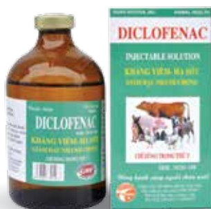
Chai 20ml, 100ml