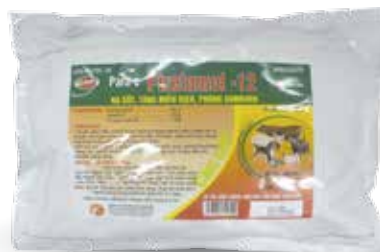
Túi 100g, 1kg