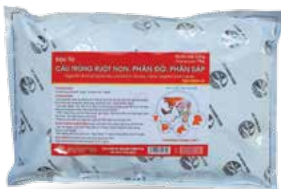
Túi 10g, 50g, 100g, 1kg