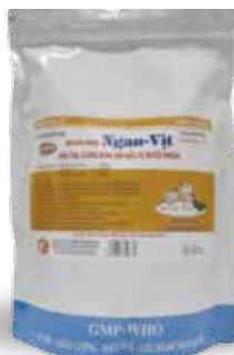
Túi 50g, 100g, 1kg

Hòa nước uống hoặc trộn thức ăn - Gia cầm: 10g/ 30 kg TT/ ngày. Hoặc 10g/ 10 lít nước cho uống. - Gia súc: 10g/ 30-50 kg TT/ ngày. Liều phòng bằng ½ liều chữa.