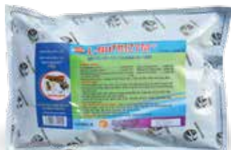
Túi 500g, 1kg, lon 1kg