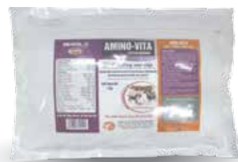
Túi 500g, 1kg