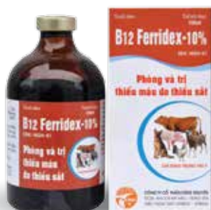
Chai 10ml, 20ml, 100ml