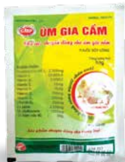
Túi 10g, 50g, 100g, 1kg