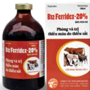
Chai 10ml, 20ml, 100ml