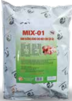
Túi 500g, 1kg