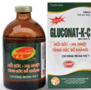
Chai 20ml, 100ml