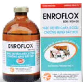
Chai 20ml, 100ml