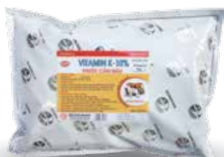
Túi 100g, 1kg

* Lợn cai sữa đến 70 ngày tuổi: trộn 1kg với 25-30 kg thức ăn