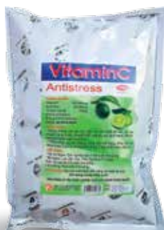
Túi 100g, 500g, 1kg

Dùng liên tục trong thời gian chăn nuôi.