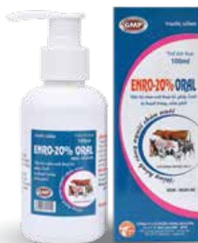
Chai 100ml, 1 lít