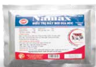
Túi 10g, 100g, 1kg

Hòa nước cho uống hoặc trộn với thức ăn. Dùng từ 3-5 ngày. - Gà, vịt, ngan, cút, bồ câu: 1g/25-30kg TT/ngày Hoặc 1g/4-5 lít nước - Lợn, trâu, bò, dê, cừu: 1g/40-50kg TT/ngày Ngừng dùng thuốc trước khi giết mổ 5-7 ngày