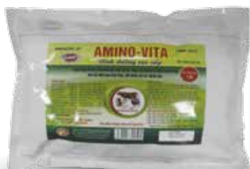
Túi 500g, 1kg