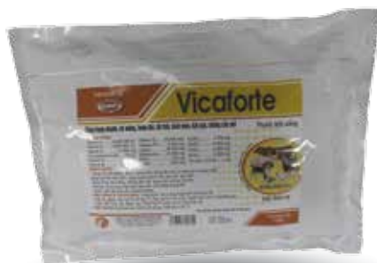
Túi 100g, 500g, 1kg