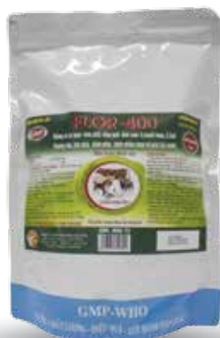
Túi 10g, 50g, 100g, 1kg

- Liều phòng: bằng 1/2 liều điều trị. Định kỳ cách nhau 7-10 ngày.