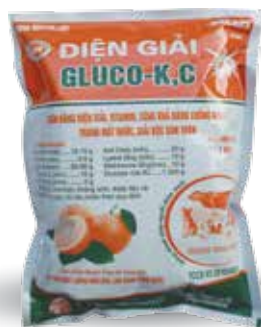
Túi 100g, 500g, 1kg