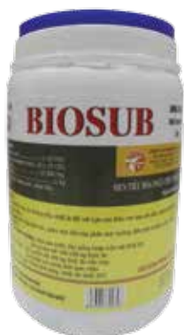
Túi 100g, 1kg, lon 1kg

Hoà nước cho uống hoặc trộn với thức ăn - Lợn con: trộn 100g với 50-100 kg thức ăn, trộn trực tiếp vào cám cho ăn cùng lợn mẹ hoặc hoà riêng vào máng cho uống. - Lợn thịt: trộn 100g với 100-200 kg thức ăn. Cho ăn liên tục trong thời gian chăn nuôi.