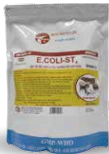
Túi 10g, 50g, 100g, 1kg