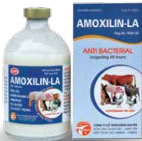
Chai 20ml, 100ml