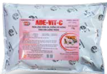
Túi 100g, 500g, 1kg, lon 1kg