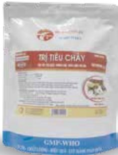
Túi 10g, 50g, 100g, 1kg

- Gà, Vịt, Ngan, Cút: 1g/ 8-10kg TT/ngày. Hoà với 2 lít nước uống. Hoặc trộn với 1kg thức ăn. - Lợn, chó, mèo: 1g/10 kg TT/ ngày. Dùng từ 3-5 ngày. - Đê, cừu, bê, nghé: 1g/ 15kg TT/ngày. Dùng từ 3-5 ngày.