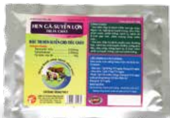
Túi 10g, 50g, 100g, 1kg

Hòa nước uống hoặc trộn thức ăn - Gà, Vịt, Ngan, Cút: 1g/ 5-7 kg TT/ ngày. Hoặc 2g/ 1 lít nước uống. - Lợn, Bê, Dê, Cừu: 1g/ 6-9 kg TT/ ngày. Dùng liên tục từ 3-5 ngày Phòng bệnh: dùng bằng 1/2 liều điều trị.