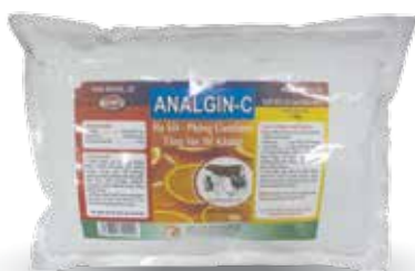
Túi 100g, 1kg