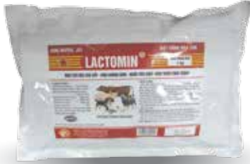
Túi 500g, 1kg, Thùng 10kg