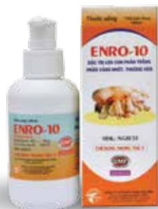
Chai 10ml, 100ml, 500ml, 1 lít