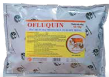
Túi 50g, 100g, 1kg

- Trị bệnh: + Gia súc: 1g/ 10kg TT/ ngày. Dùng từ 3-5 ngày + Gia cầm: 1g/5-7 kg TT/ ngày. Hoặc 1g/1 lít nước. Dùng từ 3-5 ngày. - Phòng bệnh: bằng 1/2 liều điều trị.