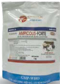
Túi 10g, 100g, 1kg

- Lợn, Bè, Nghé: 1g/20 kg TT/lần. Ngày 2 lần. Dùng từ 3-5 ngày.