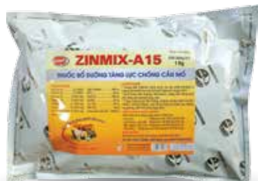
Túi 100g, 500g, 1kg

- Gà, Vit, Ngan: 1g/10-15 kg TT, hoà với 3 lít nước. Hoặc trộn với 50 kg thức ăn.