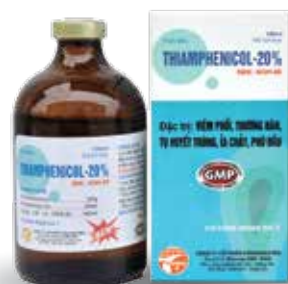
Chai 20ml, 100ml