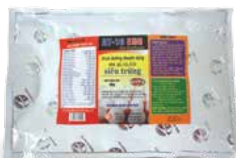
Túi 500g, 1kg

Trộn với thức ăn Heo thịt, Gà, Vịt, Ngan, Cút: 1kg/700 kg thức ăn hỗn hợp. Dùng liên tục từ khi nuôi đến khi xuất bán.