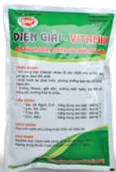
Túi 100g, 1kg

Dùng liên tục trong thời gian chăn nuôi.