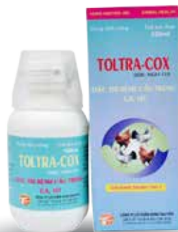
Chai 100ml, 500ml, 1lit