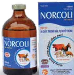
Chai 20ml, 100ml