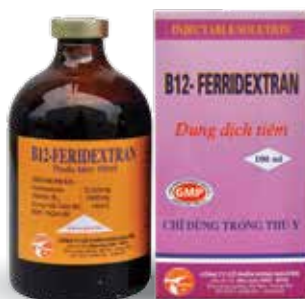
Chai 20ml, 100ml

* Gia cầm: 10 ml/2 lít nước uống/ 20kg TT