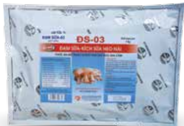
Gói 500g, 1kg, lon 1kg