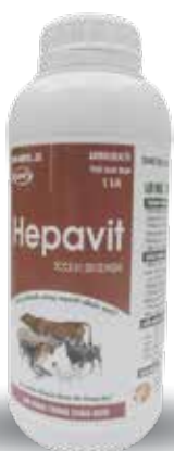
Chai 500ml, 1lit