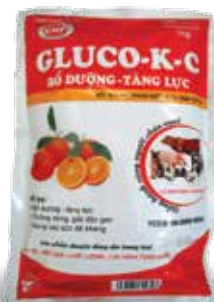
Túi 200g, 500g, 1kg