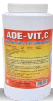
Túi 100g, 500g, 1kg