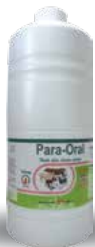
Chai 100ml, 500ml, 1 lít