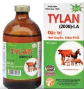
Chai 20ml, 100ml