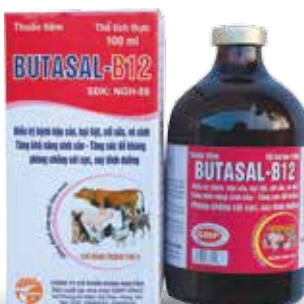
Chai 500ml, 1lit