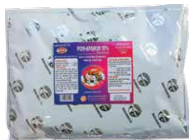
Túi 100g, 1kg

Hòa nước cho uống hoặc trộn thức ăn * Gia cầm: 1g/20-30 kg TT/ ngày hoặc 1g/4-6 lít nước. Dùng từ 3-5 ngày. * Gia súc: 1g/40-45 kg TT/ ngày. Liều phòng bằng ½ liều điều trị.