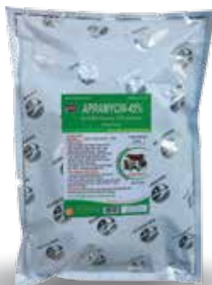
Túi 100g, 1kg

- Gia súc: 1g/1 lít nước hoặc 1g/20 kg TT. Dùng liên tục từ 3-5 ngày.