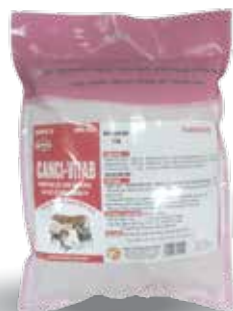
Túi 100g, 500g, 1kg