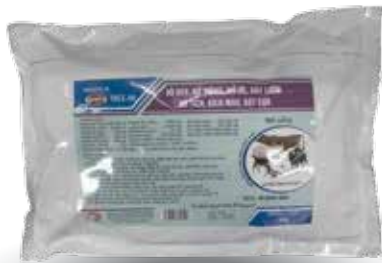
Túi 500g, 1kg