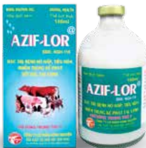
Chai 50ml, 100ml