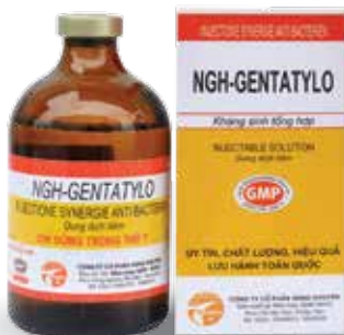
Chai 10ml, 20ml, 100ml