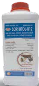
Chai 500ml, 1lit