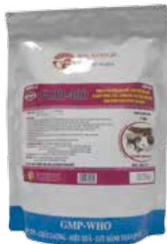
Túi 10g, 50g, 100g, 1kg