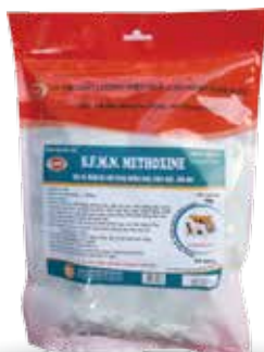
Túi 100g, 1kg

Hòa nước cho uống hoặc trộn với thức ăn. Dùng từ 5-7 ngày. - Gà, vịt, ngan, cút: 1g/6kg TT/ngày Hoặc 1g/1 lít nước - Lợn: 1g/10kg TT/ngày