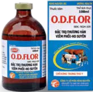
Chai 20ml, 100ml