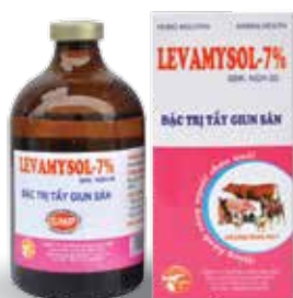
Chai 10ml, 20ml, 100ml