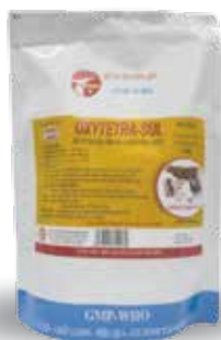
Túi 10g, 100g, 1kg

Hòa nước uống hoặc trộn thức ăn - Gà, Chim Cút: 1g/4-5 kg TT/ ngày. Dùng từ 3-5 ngày - Vịt, Ngan, Ngỗng: 1g/4-5 kg TT/ ngày. Dùng từ 3-5 ngày. Hoặc 10g hoà với 1 lít nước cho uống, Dùng từ 3-5 ngày Liều phòng bằng ½ liều điều trị - Lợn, bê, nghé, dê, cừu: 1g/8-10 kg TT/ ngày. Hoặc 10g trộn với 5 kg thức ăn hỗn hợp. Dùng từ 3-5 ngày.