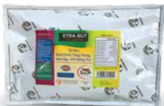
Túi 500g, 1kg, 10kg