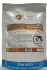
Túi 50g, 100g, 1kg, lon 1kg

- Gia cầm: 1g/10-15kg TT/ ngày. Hoặc 1g/ 1-2 lít nước - Lợn, chó, mèo: 1g/ 10kg TT/ngày - Bê, dê, cừu: 1g/ 10kg TT/ngày Dùng từ 3-5 ngày