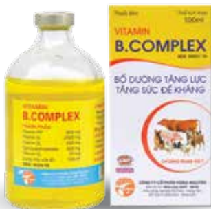
Chai 20ml, 100ml