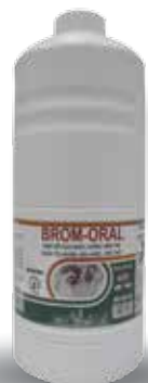
Chai 100ml, 500ml, 1 lit

Ngừng dùng thuốc trước khi giết mổ 15 ngày