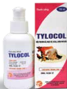
Chai 10ml, 100ml, 500ml, 1 lít

Nhỏ trực tiếp vào miệng hoặc hoà vào nước cho uống. Lợn: 1 ml/10-15 kg TT. Dùng liên tục 2-3 ngày.