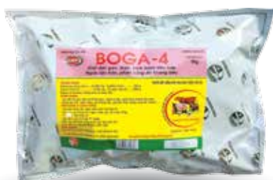
Túi 100g, 500g, 1kg