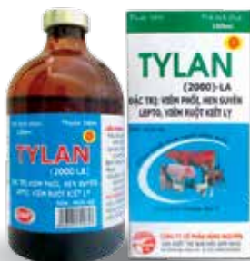
Chai 20ml, 100ml

* Chú ý: không tiêm quá 10ml trên cùng 1 vị trí tiêm.