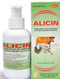
Chai 10ml, 100ml, 500ml, 1 lít

Hòa nước cho uống hoặc nhỏ trực tiếp vào miệng - Gà, Vịt, Ngan, Ngỗng: 100ml dùng cho 200-300 kg TT/ngày Dùng từ 3-5 ngày Liều phòng bằng 1/2 liều điều trị - Lợn: 100 ml dùng cho 1000 kg TT/ ngày Dùng liên tục từ 3-5 ngày