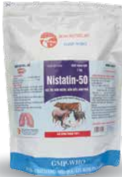
Túi 50g, 100g, 1kg