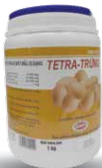
Túi 500g, 1kg, lon 1kg