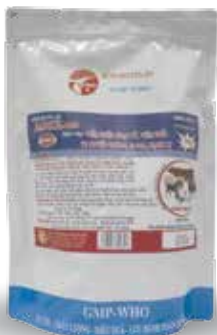
Túi 50g, 100g, 1kg

* Gia cầm: 1g/3-5 kg TT/ ngày. Hoặc 2g/1 lít nước cho uống. * Lợn, Chó, Mèo: 1g/20 kg TT/ ngày. * Đê, Cừu, Bê, Nghé: 1g/25 kg TT/ngày. Dùng từ 3-10 ngày. Hoặc 1g trộn với 1kg thức ăn, dùng 3-5 ngày. * Chú ý: nên dùng kết hợp với kháng sinh trong điều trị bệnh hen suyễn, viêm đường hô hấp.