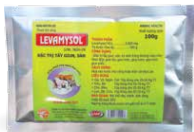
Túi 2g, 10g, 50g, 100g, 1kg

Hoà với nước cho uống hoặc trộn vào thức ăn - Gà, Vịt, Ngan, Cút: 1-2g/10 kg TT/ ngày. Hoà với 1 lít nước cho uống. - Bê, Nghé, Lợn, Đê, Cừu non: 1-2g/10 kg TT/ ngày.. Dùng liên tục 3-5 ngày