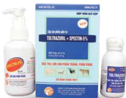
Chai 20ml, 50ml