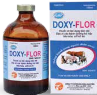
Chai 20ml, 100ml