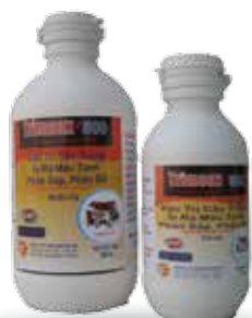
Chai 100ml, 250ml, 500ml