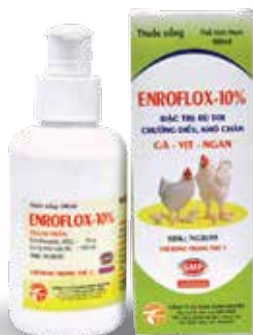
Chai 10ml, 100ml, 500ml, 1 lit