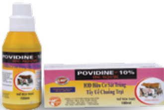
Chai 100ml, 1 lít

Iod hữu cơ sát trùng, tẩy uế chuồng trại