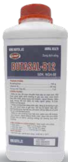
Chai 20ml, 100ml

- Gia súc: Tiêm bắp 1 ml/ 20 kg TT/ ngày. Dùng trong 3 ngày.