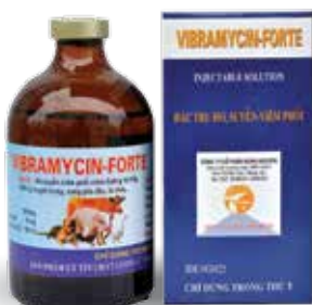
Chai 10ml, 20ml, 100ml