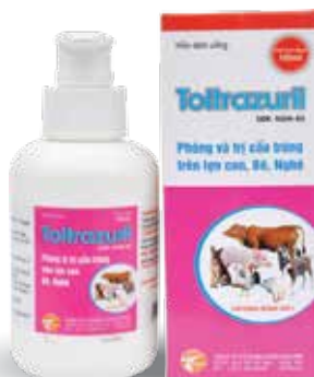
Chai 100ml, 500ml, 1lit

- Hòa vào nước cho uống - 100ml / 100 lít nước uống dùng liên tục trong 48h - Hoặc 150ml / 50 lít nước uống dùng 8h/ngày Dùng liên tục 2 ngày