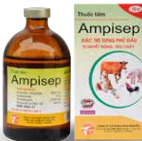
Chai 20ml, 100ml