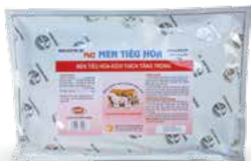
Túi 100g, 500g, 1kg, 10kg

Trộn vào thức ăn nguội. Dùng cho Trâu bò, Lợn, Gà, Vịt, Ngan, Ngỗng... trộn đều 0,5-1 kg/100 kg thức ăn. Cho ăn liên tục trong thời gian nuôi.