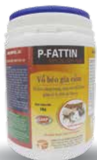
Túi 500g, 1kg, 10kg

- Lợn, Bê, Nghé, Dê, Cừu: 10g/80-100 kg TT/ ngày. Hoà nước cho uống. Dùng liên tục trong thời gian chăn nuôi.