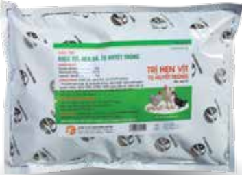
Túi 10g, 50g, 100g, 1kg