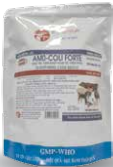
Túi 10g, 100g, 1kg

Hòa nước uống hoặc trộn thức ăn Gà, Vịt, Ngan, Cút: 1g/ 3-5 kg TT/ ngày. Hoặc 1g/ 0,5 lít nước uống. Dùng liên tục từ 3-5 ngày.