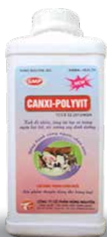
Chai 100ml, 1000ml