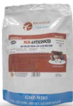
Túi 10g, 50g, 100g, 1kg

Nhỏ trực tiếp hoặc hòa nước cho uống - Lợn con 3-5 ngày tuổi uống 1 liều duy nhất: 0,5ml / con - Lợn choai: 1ml / 2,5-3kg TT/ ngày - Đê, cừu non: 1,5ml/ 10kg TT dùng liên tục 3-5 ngày. Liều phòng bằng 1/2 liều điều trị, phòng định kỳ cách 7-10 ngày.