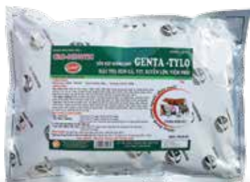
Túi 10g, 50g, 100g, 1kg

Hòa nước uống hoặc trộn thức ăn. 1g trộn với 0,5 kg thức ăn hoặc hoà với 1 lít nước cho uống. Dùng liên tục trong thời kỳ úm gia cầm.