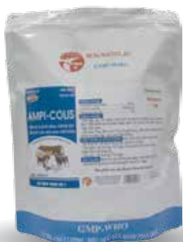
Túi 10g, 50g, 100g, 1kg, lon 1kg