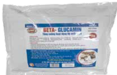
Túi 200g, 1kg

Dùng liên tục trong thời gian chăn nuôi.