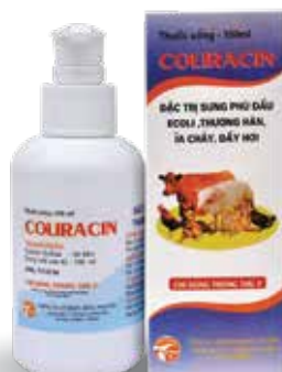
Chai 10ml, 100ml, 500ml, 1 lít

Nhỏ trực tiếp hoặc hòa nước uống - Gà, Vịt, Ngan, Cút: 10 ml (10 lần bơm) hoà với 1 lít nước cho uống Hoặc nhỏ trực tiếp 1-2 giọt (0,1-0,2 ml) vào miệng - Lợn, Bè, Nghé: 10 ml (10 lần bơm)/ 5 kg TT. Hoặc hoà vào 0,5 lít nước cho uống.