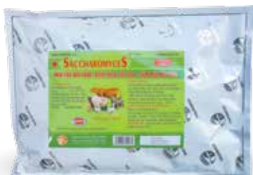
Túi 500g, 1kg