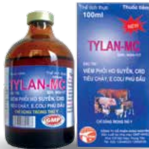
Chai 20ml, 100ml