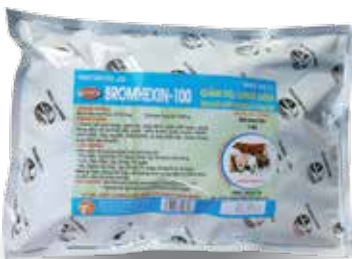
Túi 100g, 1kg

- Lợn, Bê, Nghé, Đê, Cừu: 1g/ 10-15 kg TT/ lần. Dùng liên tục 3-5 ngày. Phòng bệnh bằng 1/2 liều điều trị - Gà, Vịt, Ngan, Cút: 1g/ 6-8 kg TT/ ngày. Hoặc 1g/ 2 lít nước uống. Dùng từ 3-5 ngày.