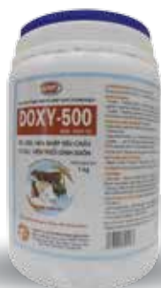
Túi 50g, 100g, 1kg