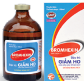
Chai 20ml, 100ml