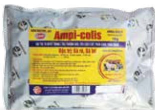
Túi 10g, 50g, 100g, 1kg